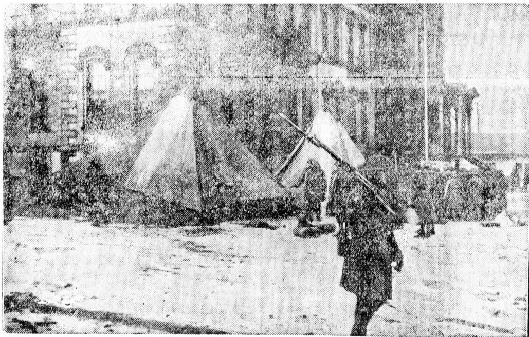
Katonaság őrzi az amerikai autógyárakat

Admira—Jugoszlavia 4:0 (2:0). Belgrádból jelentik: A bécsi bajnokcsapat keleti turájáról hazatérőben játszott a jugoszláv fővárosban és könnyen győzött.