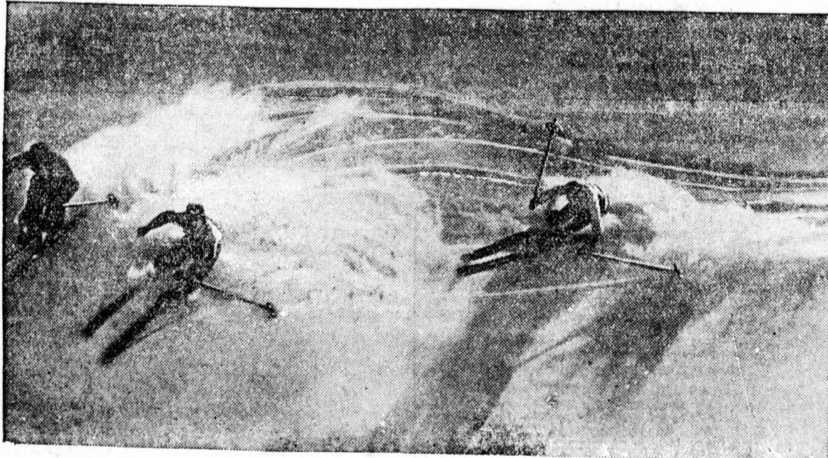
Teljes irammal sítalpakon.

Nagytakarítás az emberi szervezetben. Kulturált emberek feltétlenül szükségesnek tartják, hogy lakásukban bizonyos időközönként nagy-takarítást végezzenek, mely alkalommal a felgyülemlett port a legelőnyösebb sarokból is eltávolítják. Csak bámulunk azon, hogy mennyi por is gyűl össze ezeken a helyeken, azonban a nagy takarítás után lakásunk világosabb, barátságosabb. Könnyen megérthető, hogy az emberi szervezet is — a belső szerveket, a több kilométer hosszú csőrendszert, — időnkint alaposan át kell öblítenünk, ki kell takarítanunk. Az a tisztítás amit a szervezet maga, természetes uton elvég-z nagyon gyakran nem elegendő arra, hogy a betegségek okozó bacillusokat, amelyek a szervezetben felgyűlhetnek, eltávolítsa. Különösen a vesék — amelyeknek finom csőrendszerében a bacillusok végzetes pusztítást okozhatnak — szorulnak rá feltétlenül az alapos tisztításra. A szervezet eme „nagytakarítását” Helmitol tablettákkal fárad-ság nélkül elvégezhetjük. A Helmitol átöblíti, az egész szervezetet, átmossa a belső szervek legfi-nomabb csőrendszerét is és elpusztítja a betegség okozó bacillusokat. Az az ember, aki meg akarja előzni a betegségeket, bizonyos időközönként ki-takarítja szervezetét Helmitol tablettákkal.