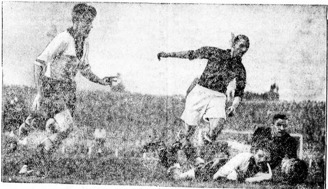
Németország labdarugói döntetlenül végeztek a hollandokkal.

A. P. T. Kifünnő cikkét lapunk jövő vasárnapi számában örömmel közöljük; mindezt azért nem jelent meg, mert terjedelménél fogva nehéz beleszorítani egy napilap kereteibe.