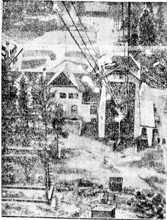
Uj hegyipálya Bajorországban.

Nagy érdeklődés nyilvánul meg az EGE vetőmagkiállítására és vásárlásáért. Az EGE, mint már lapunkban jelentettük, február hó 21-27. napjain tartja szokásos tavaszi vetőmagkiállítását és vásárját Clujon. A CFR vezérigazgatósága a vidékről a kiállításra felutazóknak visszautazáshoz 50 százalékos kedvezményt engedélyezett. Eddig számos gazda küldött be váltoatos kiállítási anyagot. A székely vidékről szép fillér-lencse érkezett. Különös feltűnést fog kelteni a minden vidékről beérkezett számos kukorica minta. A kiállításon résztvesznek a külföldi magnemesítő állomások is. Eddig a lovászpatai, bánkúti, hatvani magyarországi nemesítő telepek jelentették be részvételüket. A kiállításon bemutatja a Gazdasági Egylet az ujszerű takarmány konzerválási eljárásokat és erjesztett takarmány mintát is fog kiállítani. A kiállítás célja a nemesített vetőmagvak, vetőgumóknak közvetlenül a kereskedelem kizárásával a kis és nagy gazdák rendelkezésére bocsátása. Érdeklődőknek készséggel nyújt felvilágosítást az EGE titkári hivatala: Cluj, Str. Andrei Muresan 10.