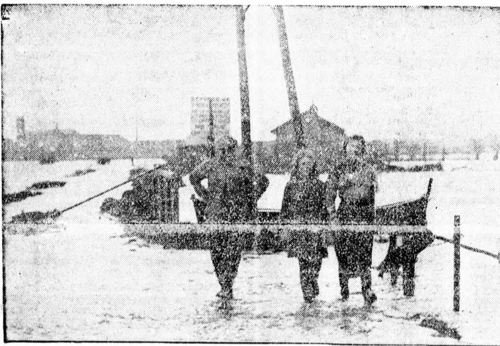
Az északfranciaországi Armentiere-i városkát elöntötte az árvíz Képünkön a városka külvárosa látható

Beszűntetett magyarnyelvű ujság. Targu-Mureş. Saját tud. A belügyminisztérium központi rendőrigazgatósága hétfőn érkezett 10.119-937. sz. leiratával, mely február 21-én kelt, indokolás nélkül beszüntette a tg.-muresi „Reggeli Ujság” címen megjelent napilapot. A betiltás bizonytalan időre szól. A szerkesztősége mindent megtesz a betiltó rendelet visszavonása érdekében, bár a betiltás okai ismeretlenek.