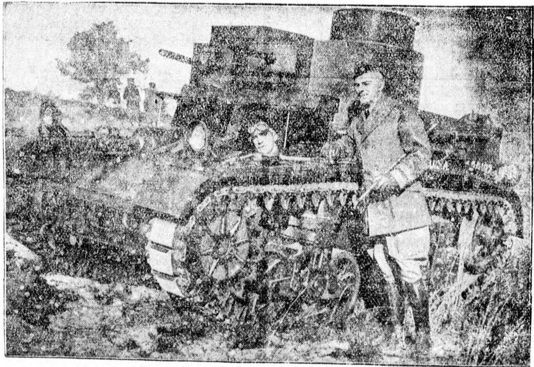
Az amerikai hadsereg új harcikocsija, amely teljes megterheléssel 70 kilométeres sebességgel haladhat.

Rómából jelentik: A római Nemzetközi Mezőgazdasági Intézet jelentése szerint a világ búzakészlete február 1-én kerek 336 millió bushel volt, ami 24 millió bushellel haladta meg a januári készletet. Emelkedtek a készletek Ausztráliában és Argentínában, valamint az uszó készletek összesen 53 millió bushellel s csökkentek Észak-Amerikában és Angliában 29 millió bushellel. 1935 február 1-én a készletek mennyisége 469 millió, 1935 február 1-én pedig kerek 517 millió bushel volt.