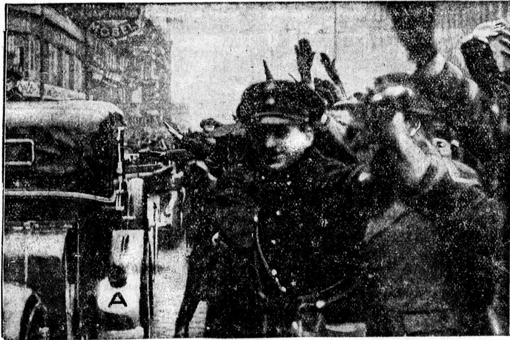
Neurath német külügyminiszter távozása Bécsből.

Budapestről jelentik: Hétfőn, késő délután Darányi Kálmán miniszterelnöknél fontos miniszterközi tárgyalás volt. A tárgyalás az éjszakai órákig elhúzódott. A tanácskozáson fontos külkereskedelmi gazdasági kérdések, többek között a román—magyar kereskedelmi tárgyalások előkészítése került megvitatásra.