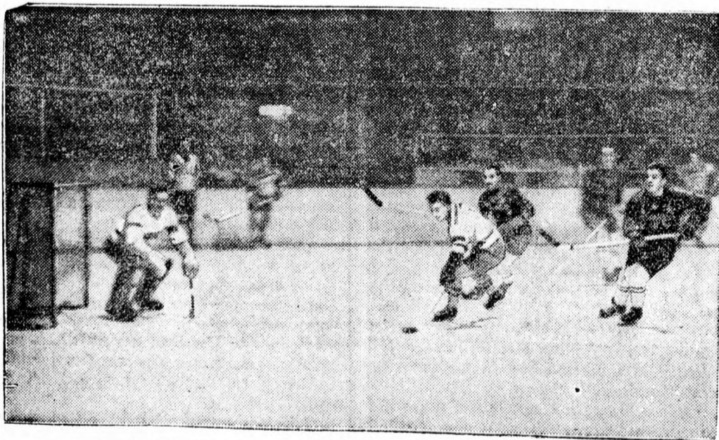
Izgalmas pillanat a kanadai-német jégkorong mérkőzésen.