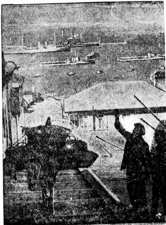
Megkezdődött a tengeri ellenőrzés Spanyolországban.

Rátért a horvát kérdésre is és kijelentette, hogy elérkezett a horvátokkal való megegyezés ideje.