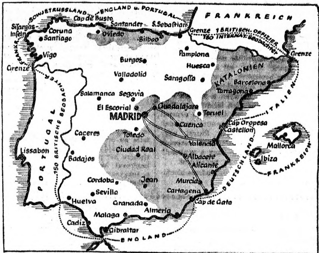
A spanyol polgárháború mai állása:

Mint ahogy ez az iskola padjaiban szokás. (J. B.)