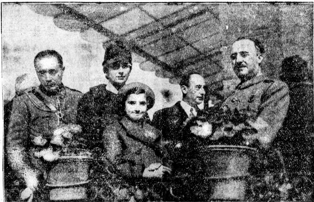
Franco tábornok családja körében.

Víz alá került Tg.-Săuceșc egyik városrésze. Saját tud. A hirtelen enyhére fordult idő napok alatt elolvastotta a mező hótakaróját, de mert az árkok szüntől felfagytak, a nagy víztömeg nem a patakok medrébe huzódott le, hanem Tg.-Săuceșc egyik városrészét az u. n. Degociát öntötte el. Az éjszaka betörő ár elől a lakók a házak padlására menekültek, a férfiak pedig a városi utászokkal hamarosan megkezdték a gát építését, mely eredménnyel is járt a árvízveszély elmúlt.