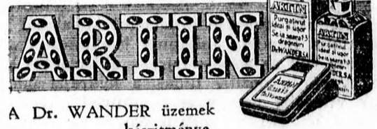
A Dr. WANDER üzemek készítménye.

jait, ahol senki sem akarta őket befogadni, a nyári hőségtől tüzes homoksvatagon keresztüli negyvennapos vándorlás szenvedéseit s a száraz szavakból is kiérezni azt a meghatottságot, amelyet a hős Juliánusz barát érezhetett, amikor az első magyar telepre érkezett, ahol „amint meglátták őt s megértették, hogy magyar, házról-házra s faluról-falura vezetik”. Mindenhol megértik Juliánusz barátot, emlékeznek a 3—400 esztendővel ezelőtt elszakadt testvérekre. Egy hónapig volt Juliánusz barát az őshazai magyarok között s azután hazahívta a kötelességtudat. A magyarok új utat mutatnak s Juliánusz már erre veszi útját. Ugyanolyan kalandok és küzdelmek után 1237 januárjában kopogtat be a sárospataki rendház kapuján.