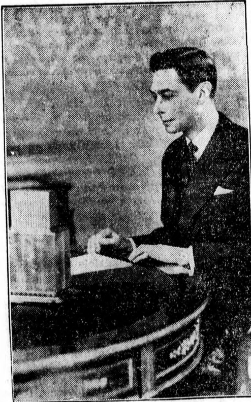
VI. György angol király a rádió mikrofonja előtt.

Szabadságvesztésre ítélték egy tizenöt éves gyermeket. Mercurea-Ciuc. Saját tud. Mult év nyarán hirtelen kigyult Barabás István sán- dominici gazda csüre és a benne lévő gazdasági felszereléssel és takarmánnyal együtt leégett. A vizsgálat megállapította, hogy a csürt egy tizenöt éves gyermek gyújtotta fel. Az új bün- tetőtörvénykönyv szerint tizenöt nappal elzárással büntették. Edesapját kötelezték, hogy tizenhá- romezer lei kártérítést záros határidő alatt fi- zessen meg.