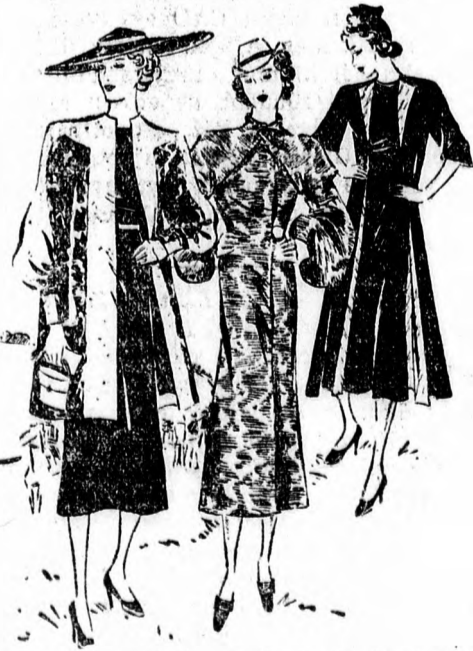
Grinos tavaszi ruhák, amelyek olesón összeállíthatók. A fekete, fehér és a barna színek dominálnak az új divatban.

1750 körül Jonas Hannay mutatta be az első esernyőt Angliában. Hannay sokat utazott és Keleten látta, hogy az emberek ernyővel védekeznek a nap és az eső ellen. Mikor Hannay először tűnt fel Anglia utcáin nyitott ernyőjével, valóságos népcsovdület vette körül és rothadt almával dobálták meg. Másnap, miután újra esett az eső, ismét nyitott ernyővel jelent meg, de az eredmény ugyanaz lett, mint az előző nap: a rothadt almák elől lakásába kellett menekülnie. Hannay azonban valahányszor esni kezdett az eső, ezután is megjelent az utcán ernyőjével és azt kiabálta az öt csufoló suhanoknak, hogy nem sokára mindenki ernyővel fog járni Londonban. Jólata azonban nem vált be, mert még harminc év telt el, amíg az esernyő polgárfogot nyert Angliában és a férfiak is használni kezdték a rossz idő kellemetlenségeinek leküzdésére.