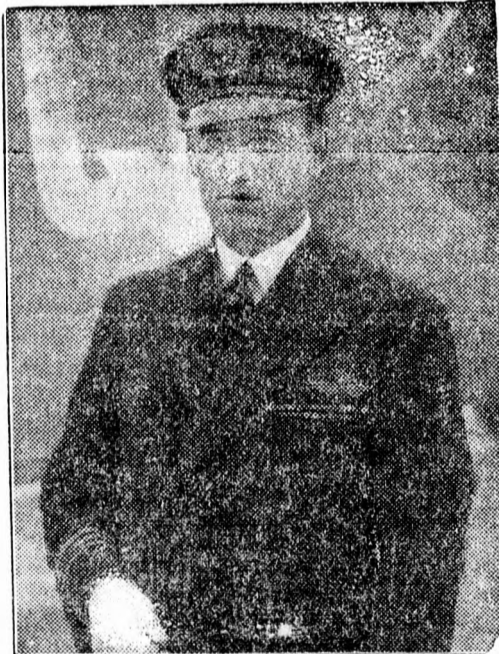
Léghajóskapitány, aki 3 millió kilométer utat tett meg a levegőben.