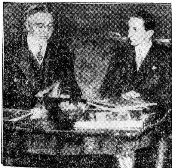
Dr. Schacht Bécsben.