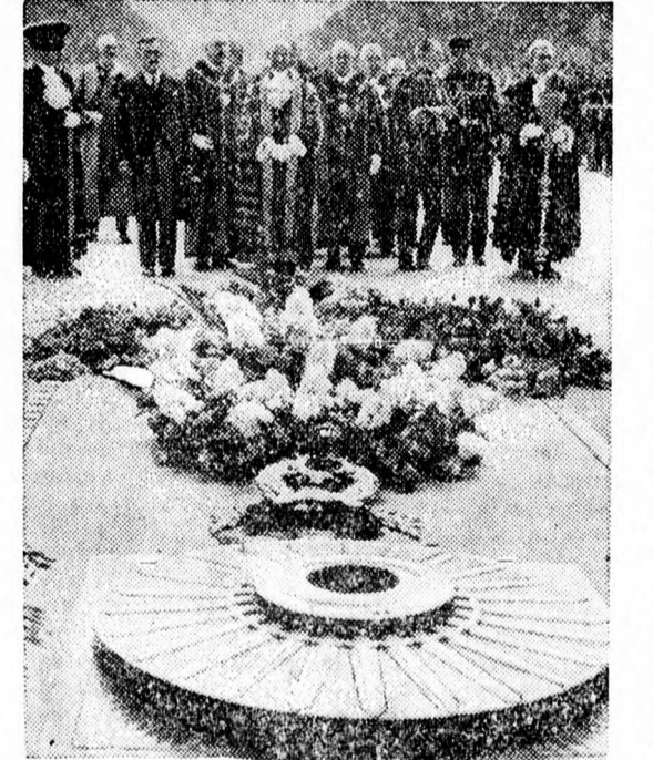
London főpolgármestere az Ismeretlen Katona párizsi sírjánál. A párizsi világgkiállítást megtekintette London főpolgármestere is, aki ünnepies keretek között megkoszoruzta az Ismeretlen Katona párizsi sír-ját. Képünk erről az ünnepies aktusról készült.