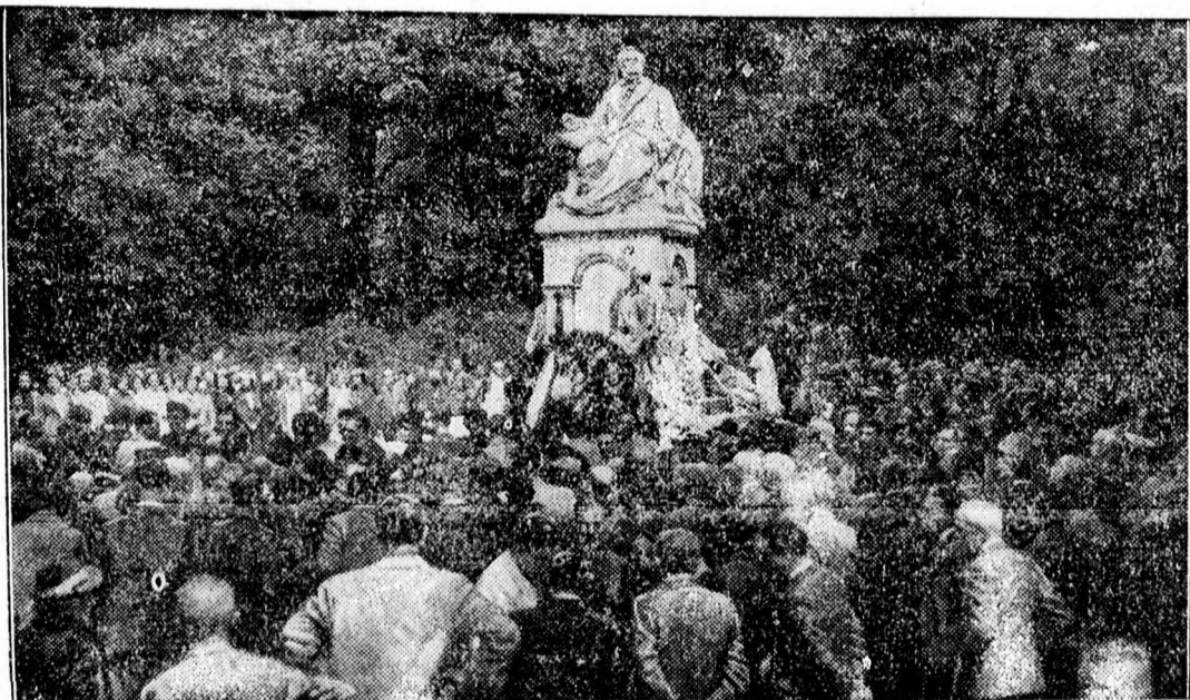
A mailandi Scala zenésztagejai berlini látogatásuk alatt megkoszorúzták Wagner Richard szobrát

PUHA OLMOT állandóan vesz a Szent László-nyomda r. l. Oradea, Str. Regele Carol II. 5. szám.