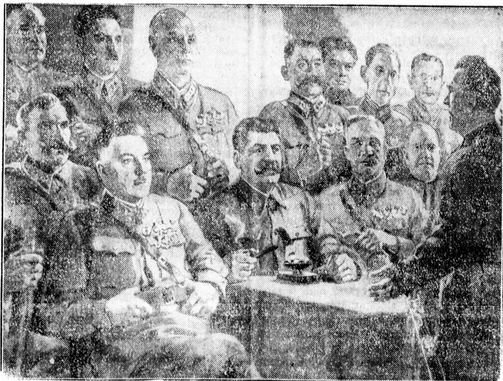
Stalin — generálisai között.

A bucuresti időjárásutató intézet jelentése szerint a várható időjárás: Változó felhőzet, kevesebb eső, a nyugati-északnyugati szél gyengül. A hőmérséklet napközben csökken, másutt emelkedik.