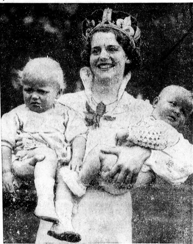
Az angliai Dartfordban gyermekszépségversenyt rendeztek, az első díjat a képünkön látható fiatal anya két gyermekével nyerte el.

Középdöntőt játszanak már Wimbledonban. Wimbledonból jelentik: Az elődöntők néhány nagy küzdelmet eredményeztek: Cramm német—Crawford ausztrál 6:3, 8:6, 3:6, 2:6, 6:2. Parker amerikai—Henkel német 6:3, 7:5, 4:6, 4:6, 6:2. Austin angol—Grant amerikai 6:1, 7:5, 6:4. Bugde amerikai—Mc Grant ausztrál 6:3, 6:3, 6:4. A középdöntőben: Budge—Parker és Cramm—Austin.