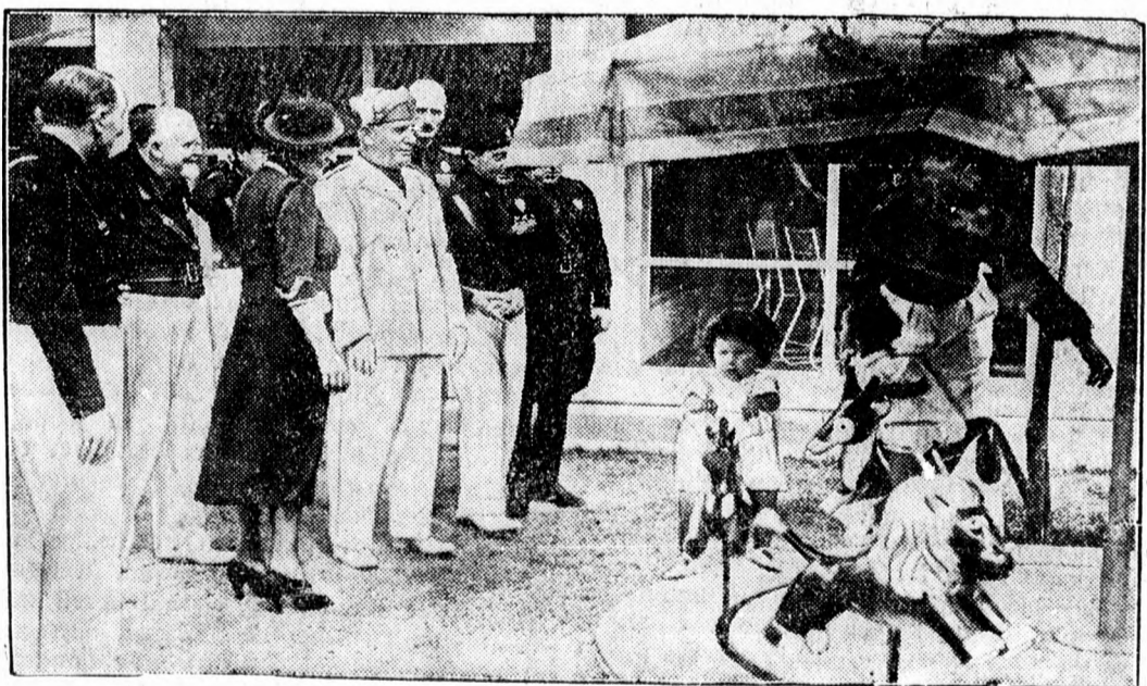
Mussolini a római fasiszta kiállításon megtekintette a gyermekjátékoszteret is. Képünk akkor készült, amikor a Duce a körhintán szórakozó gyermekeket szemlélte.