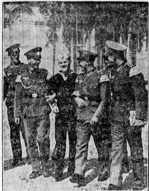
Amerikai tengerészcadétek ünneplése Potsdamban.

Vendéglői árak ellenőrzése. Timișoara. Saját tud. A városi időközi bizottság a június husz és kenyérrétek érvényességét, meghosszabbította július hónapra is és elrendelte a vendéglői árak ellenőrzését, illetve tanulmányozását. Szó van ugyanis arról, hogy a vendéglői árakat újból szabályozni fogja a város, végső esetben pedig maximalja azokat.