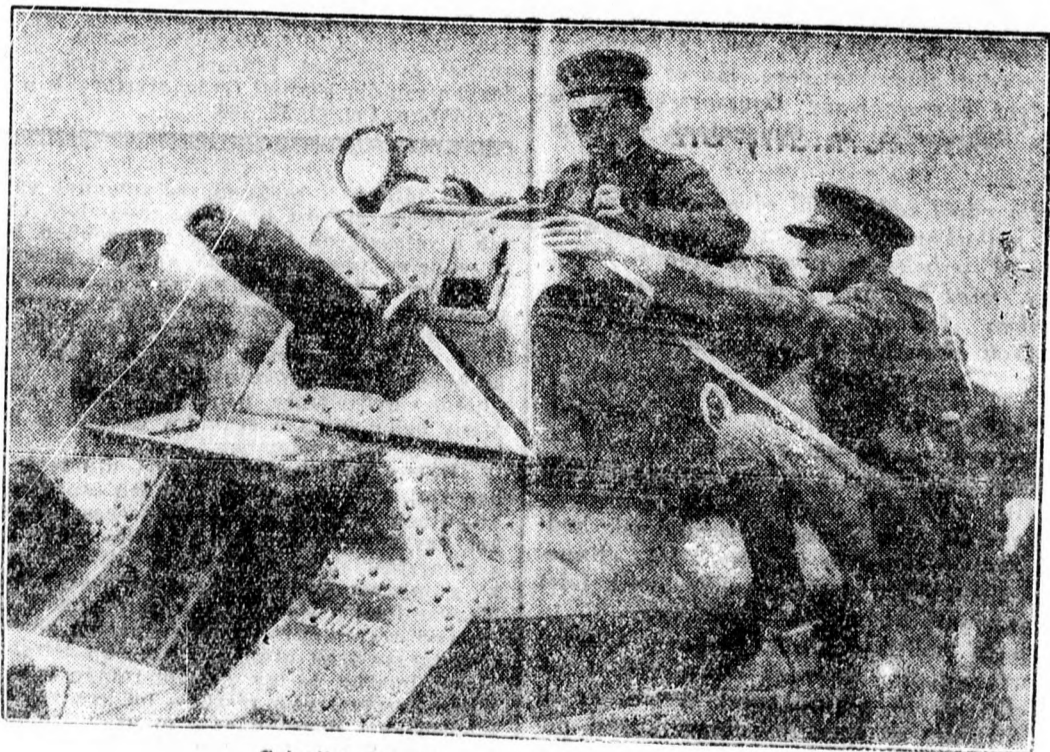
Csicsibu herceg, a japán császár fivére angol gyártmányú tank vezetését tanulmányozza.

Jelentkezési hely: Magyar Lapok utazási osztálya, Oradea, Str. Reg. Carol II., No. 5.