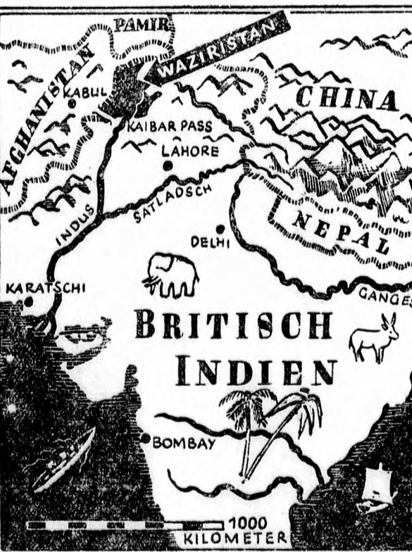
A brit-indiai lázadás térképe.

EMELKEDIK A BUZA ÁRA A NEMZETKÖZI PIACON. Londonból jelentik: Néhány nap óta a buza ára tetűnően emelkedik a nemzetközi piacon. Ennek oka elsősorban a kanadai rossz búza-termés. Hozzájárul ehhez ezenkívül az Egyesült Államok gyengébb termése és a háborús folkészültség is.