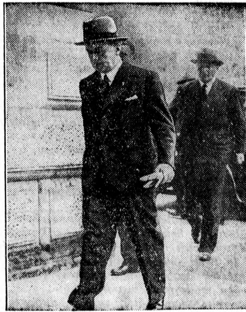
A spanyol kérdés tárgyalása Londonban.

A spanyol benemavatkozás kérdése körül állandó tanácskozások folynak Londonban. Képeink közül a baloldalin Grandi olasz nagykövet, a jobboldalin Ribbentrop, Németország nagykövete látható, amint a tárgyalásra sietnek.