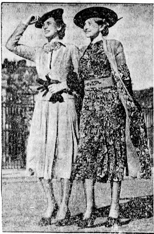
Virágminták a nyári női ruhákon.