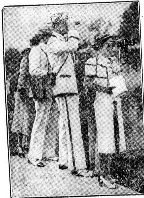
Új sportruha Angliában — a fehér-fekete.

Az intelligens főzés egyúttal mindig takarékosságot is jelent.