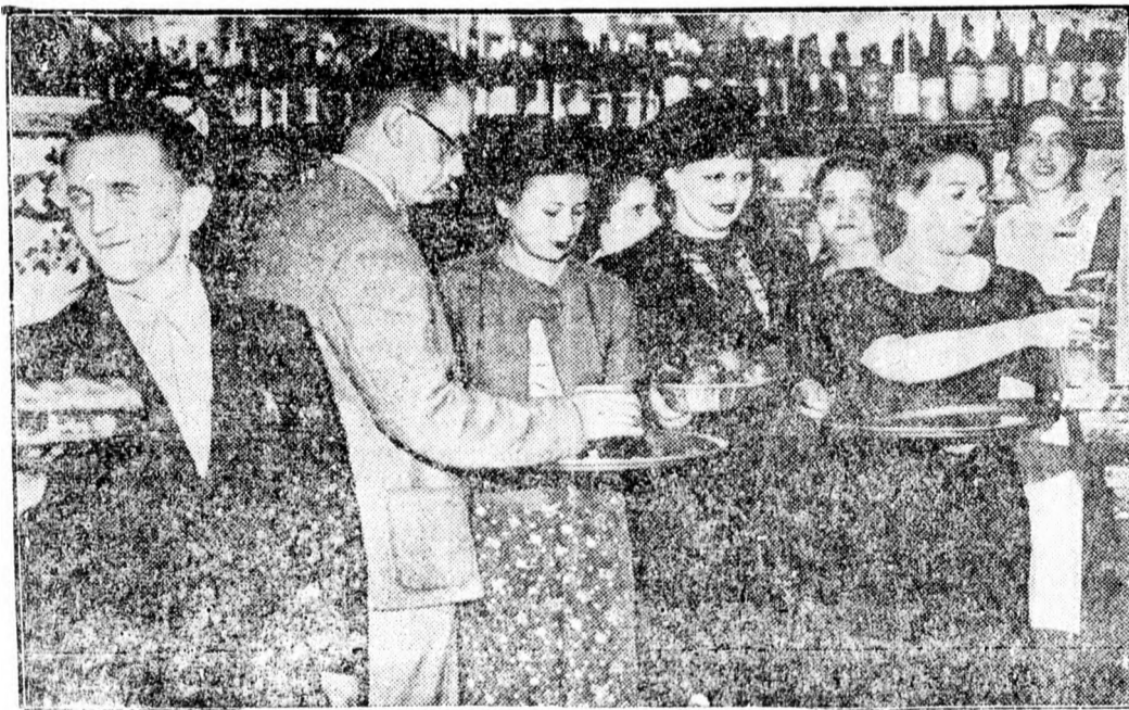
Párizsban a vendéglői és kávéházi alkalmazottak miatt segítségemmel dolgoznak a kávéházak és vendéglők.

Képünk egy nagy párizsi kávéházban készült, ahol a vendégek maguk szolgálják ki önmagukat.