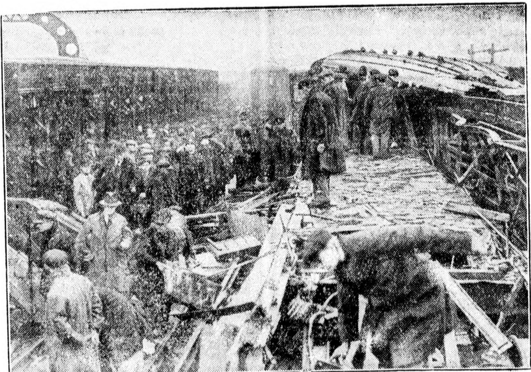
Első kép a belfasti merényletről.

Az angol királyi pár irországi látogatásakor — mint jelentettük — merényleteket követtek el. Képünk egy felrobbantott határvámépületről készült.