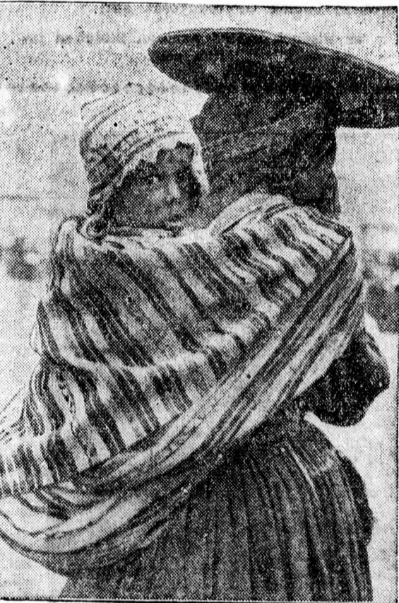
Indián anya, aki „ponchónak” nevezett kendőben, a hátán hordja kigyermekét. Az anyai szeretet egy éredek példaképe

* Felvétel az oradeai Szent József fiúnevelő Intézetbe. Az oradeai Szent József fiúnevelő intézet felvesz elemi, Gojdu liceum román és magyar tagozatára és kereskedelmi liceumba járó rendez bentlakó növendékeket. Egészséges lelki és testi nevelés, gondos felügyelet, naponként többszöri egyéni és csoportos korrepetálás, igen jó ellátás és állandó orvosi felügyelet. A hely biztosítása céljából tanácsos a növendékeket minél előbb előjegyeztetni. Tájékoztatót készséggel küld a Szent József fiúnevelő intézet igazgatósága, Oradea, Str. Brătianu 7.