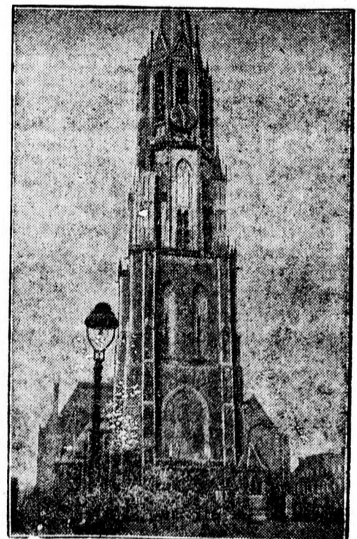
A delfti székesegyház, ahol a hollandi királyok hamvai nyugosznak.

egy- és kétszobás lakások novemberre. Oradea, Str. Dimitrie Cantemir 55.