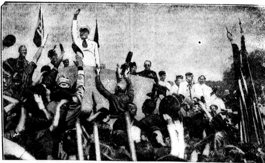
Nemzeti spanyol ifjuság ünnepléssel Mussolinit.

Egyébként pénzben nincs hiány. A kiállítás szervezőbizottságának elnöke, Grover Whalen, nemrég egykedvűen jelentette ki, hogy a kiállítás megnyitása előtt 30 vagy 40 millió dollárt fog elkölteni. Ezt az előirányzott hatalmas összeget bőven fedezik a kibocsátott elsőbbségi részvények, a kiállítás parcelláinak bérletei, főleg pedig a belépőjegyek, mert a szervezőbizottság biztosra veszi, hogy a kiállítást legalább ötvenmillió ember fogja meglátogatni.