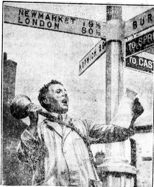
Angol város, ahol még divat a kikiáltás.

București. 7.30 A reggeli műsor közvetítése. Majd: Hírek, sport, időjárás- és vízállásjelentés. 13 Gramofonlemez. 13.25 Sporthíreknek adása. 13.40 Gramofonlemez. 14.15 Hírek közvetítése. 14.30 Gramofonlemez. 15 Hírek. 16.45 Előadás. 19 Katonazene. Majd: Hírek. felolvasás. Utána: 20 A katonazene folytatása. 20.20 Marinescu-Moceanu Mária énekel. 20.30 Felolvasás. 20.50 Hírek