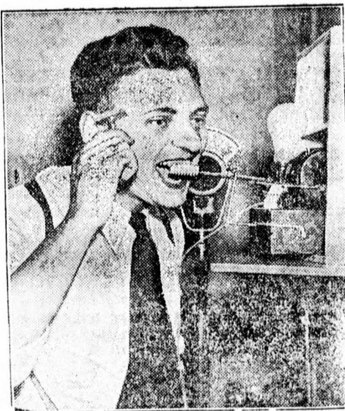
Ez is amerikai találmány.