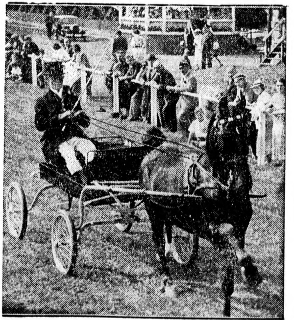
„Magas iskola” az ügétőverseny-pályán.

ELKÉSZÜLT A BALKAN LABDARUGO TORNA MŰSORA. Mindössze három állam vesz részt, mert a görögök és jugoszlávok vég-ség lemondó levelet küldtek: Október 3: Románia—Törökország. Október 7: Törökország—Bulgária. Október 10: Románia—Bulgária.