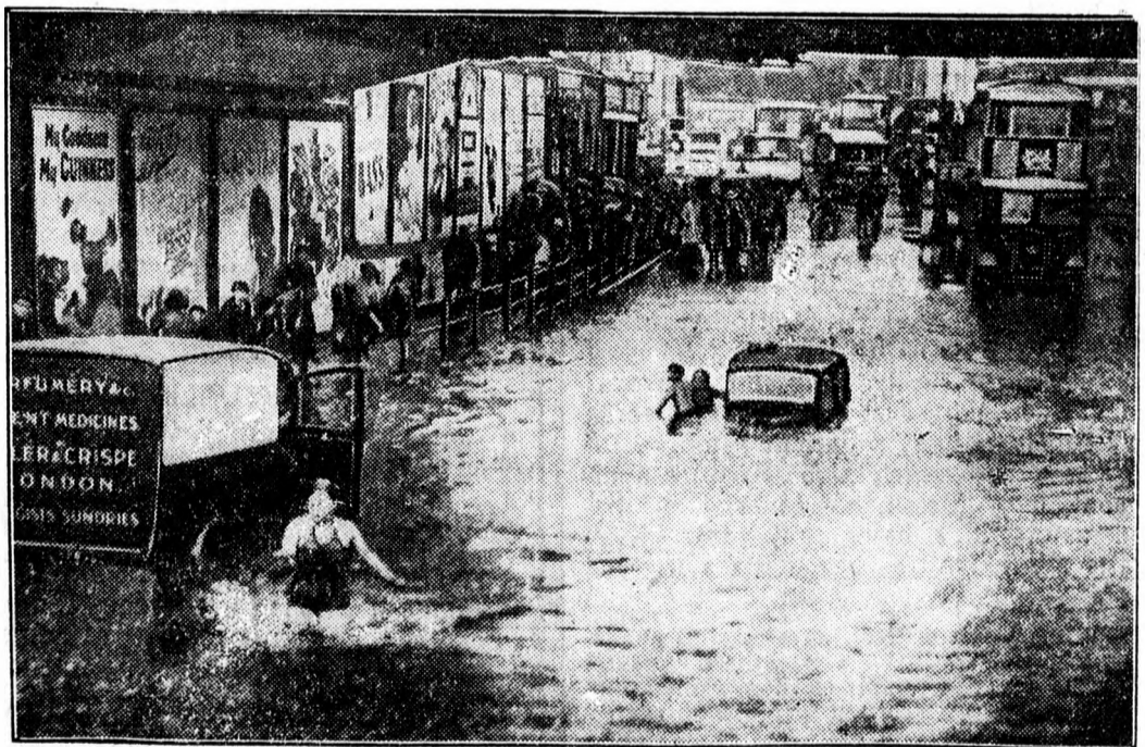
Ingyen „néplüldő” az utcán.

Japán külön hajókat épített az olimpiára. Tokióból jelentik: Az olimpiai játékokra való elő-készület Japánban lázasan folyik a Kínával szembeni háborús feszültség ellenére. Egy japán hajóépítő műhelyben megkezdtek két, külön-külön 16.500 tonnás hajó építését, melyeket 1940-re el akarnak készíteni, hogy az európai közönség szolgálatába állíthassák. A két hajó pon-toosan olyan lesz, mint a Sanfrancisco és Japán között most közlekedő személyszállító hajók. Egy másik társaság most fejezte be négy 15.000 ton-nás és 11 ezer tonnás hajó terveinek a kidolgoz-ását. Ezeket a hajókat szintén az olimpiára utazó európai és amerikai közönség szolgálatába állít-ják.