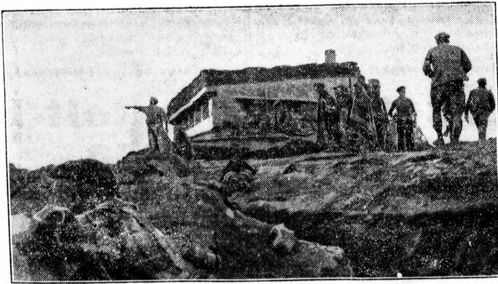
Első kép Santander ostromáról.

Az oradeai Építőiparosok Szövetsége felkéri a azobafestő és mázó szindikátus tagjait, hogy f. hó 26-án, csütörtök délután 6 órára a Munkakamara földszinti nagytermében megtartandó taggyűlésen a tárgy fontossága miatt okvetlen megjelenni sziveskedjenek. Elnökség.