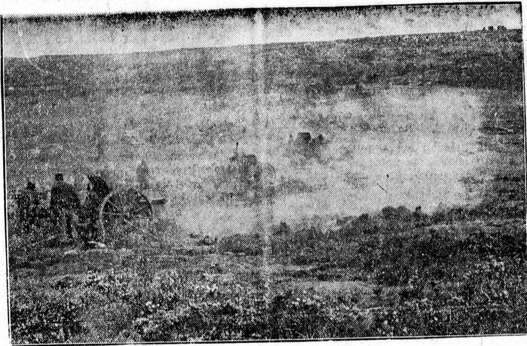
Nemzeti csapatok tüzérsége Santander alatt.

Bilbaóból jelentik: A nayarrai dandár és Franco tábornok légiói csütörtök reggel ünnepélyesen bevonultak Santanderbe. A baszk milícia megmaradt csapattestei Gijon kikötő körül helyezkedtek el. Gijon azonban már szintén tarhatatlanná vált és számolnak azzal, hogy a Santander és Lareda között zsákutcába került, mintegy 35 ezer főnyi köztársasági haderő rövidesen fogságba esik, a birtokában levő többszáz ágyuval és hatalmas mennyiségű hadianyaggal együtt.