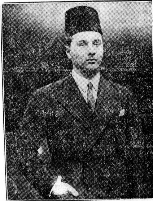
Farouk király, Egyiptom 18 éves uralkodója völegény. A menyasszonya 16 éves és ezért az esküvő csak egy év múlva lesz.

Satumare megyében tovább pusztít a villámcsapás. Saját tud. A legidősebb emberek sem emlékeznek olyan pusztításra, amelyet a villám ezúton a megyében végzett. Nem mulik el hét, hogy egy-két ház villámcsapás következtében le ne égne. Legutóbb Tarna-Maren okozott hatalmas tüzet, mely az egész községet pusztulással fenyegette. Turus Illés házába csapott bele a villám s a száraz fedél rögtön lángot fogott. Mivel a szél erősen fúj, a tűz rövidesen az egész épületet hatalmába kerítette. Szerencsére később megeredt az eső és ez megakadályozta, hogy a szomszédos épületek is meggyuljanak. Turus háza porig leégett. A kár jelentékeny.