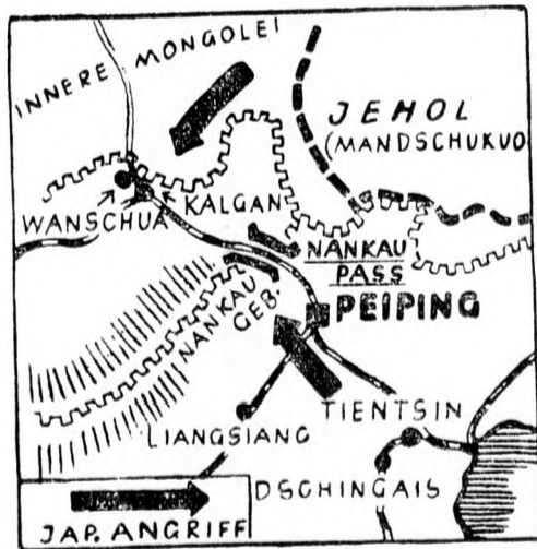
A japán—kínai háború térképe: a Peking—Nankau körüli harcokból

A lap szerint az angol jegyzék nem tartalmaz kártérítésre irányuló követelést. A jegyzék bevezetésében megállapítja, hogy az eset elbírálása szempontjából teljesen közömbös a japán kormánynak az az esetleges kifogása, mely szerint a gépkocsi zászlója nem volt elég nagy a levegő magasságából való fölismerésre. Kétségtelen, hogy a nemzetközi jogba ütköző esekelmény történt. Növeli az eset súlyosságát az a tény, hogy a két hadviselő fél között még nincs nemzetközi jogilag kinyilvánított hadiállapot.