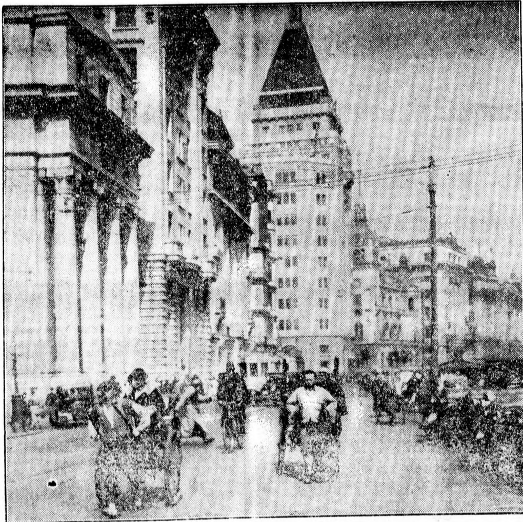
A sanghaji európai negyed angol áruházár a gránát hullt, amelynek robbanása 300 személyt megölt. Képünk Sanghaji angol negyedét a háboru előtti időből mutatja

(Tudósításunk folytatása az 5-ik oldalon).