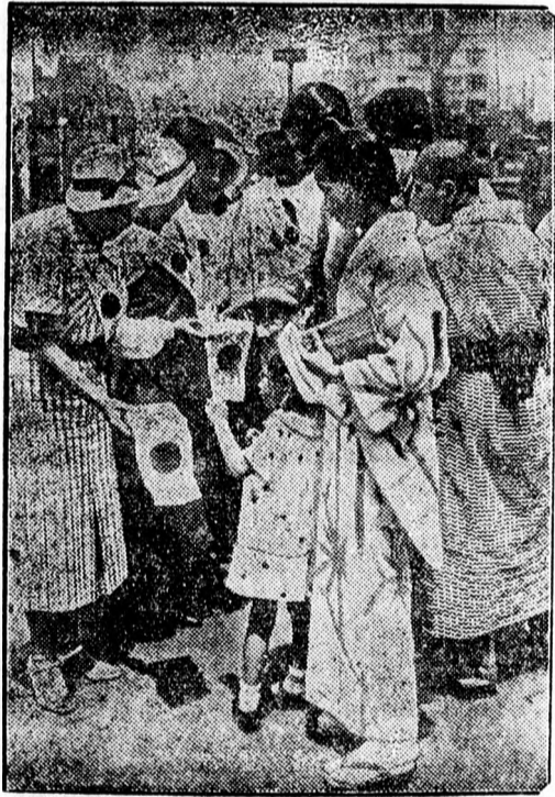
A háború megváltoztatta Tokió utcáinak képét

Jellemző a bonyhádi német ajku magyar állampolgárokra, hogy Perczel éppen a szintizta német lakosságú Belpátiban gyűjtötte össze az indulásához szükséges 150 aláírást. A vasárnapi gyűlésen pedig éppen ebben a körzetben volt a legnagyobb sikere. Tevel körzetben a bíró német és magyar nyelven üdvözölte Perczelt, aki válaszában kijelentette, hogy Magyarországon nincs különbség az állampolgárok között és minden németajku magyar állampolgár szabadon használhatja anyanyelvét, fejleszheti műveltségét, hű maradhat nemzetéhez, ha nem vét az állampolgári hűség ellen.