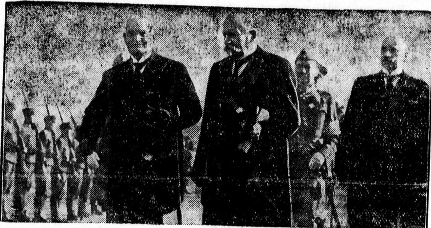
Esztország államfője Finnországban

Paets, eszt köztársasági elnök a napokban látogatást tett Finnország fővárosában, Helsinkiben. Képünk baloldalán látható az eszt elnök, amint elvonul a tisztelőre kivezényelt díszszázad előtt.