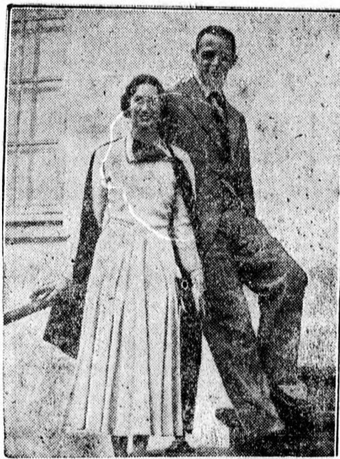
Főhercegi esküvő Koppenhágában.

FELROBBANT AZ AUTÓBUSZBAN AZ EGYIK UTAS POGGYÁSA. Bucurestiből jelentik: A Targoviste felé közeledő autóbusszban tegnap Mogoșoaia közelében robbanás történt. Az autóbusszban 30 utas foglalt helyet, akik valamennyien megsérültek. Több utas sérülése olyan súlyos volt, hogy kórházba kellett őket szállítani. A csendőrségi vizsgálat megállapította, hogy az egyik utas bőröndjében puskapor volt, amely a nagy hőségben felrobbant.