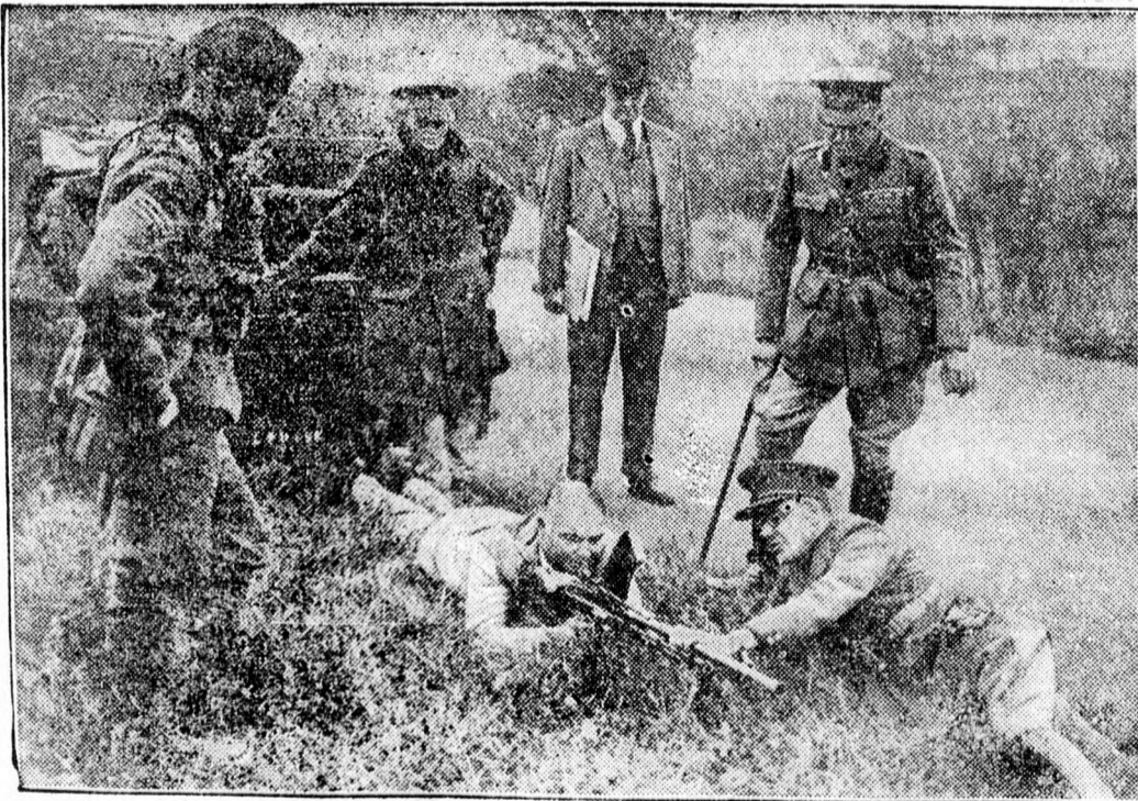
Az angol hadügyminiszternek bemutatják a legújabb típusú gépfegyvert.

Zürichi zárlat. Párizs 15.53, London 21.54 fél, Newyork 435 háromnegyed, Brüsszel 73.32 fél, Milánó 22.90, Amszterdam 239.45 fél, Berlin 174.60, Bécs — schilling 79.50, Prága 15.20, Varso 82.25, Belgrád 10, Bucuresti 325.