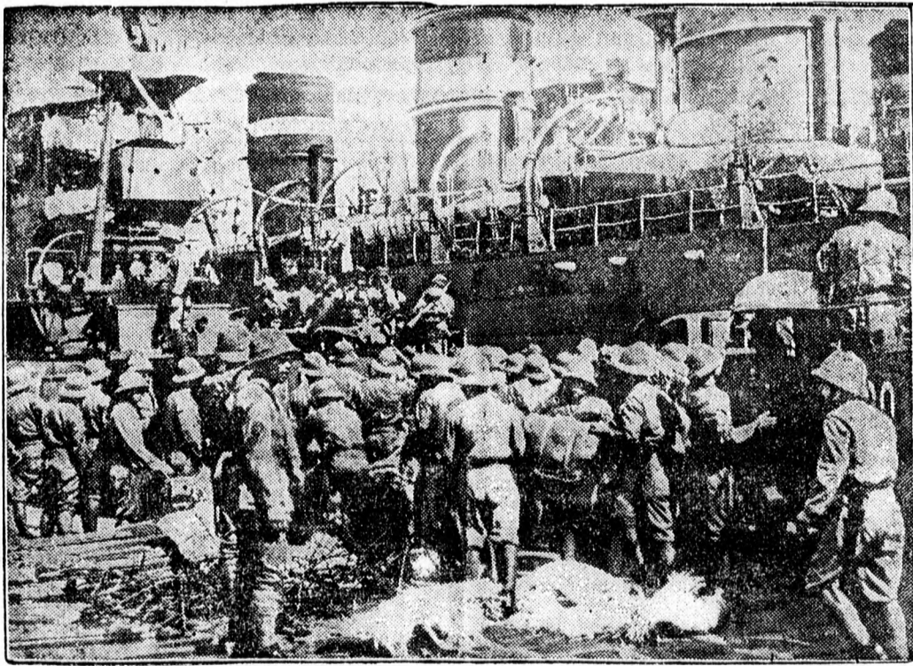
Japán csapatok szállnak partra Sanghaiban.

Bucuresti. Saját tud. A francia franknak a párizsi és londoni pénzpiacra való esése a román pénzpiacra is éreztette hatását. Az idegen pénzek szabad forgalmában a francia frank vásárlási árfolyama 6.45-ről 6.35-re esett, minthogy a bucaresti részvény- és értéktőzsde péntektől hétfőig zárva volt, a francia frank esésének hatása a börzén csak hétfőn volt érezhető, ahol ez a részvények és értékek gyöngye forgalmában nyilatkozott a frankesés miatti bizonytalanság következtében. A frank hivatalos árfolyama Bucuresztiben megmaradt 3.65 leien, a vásárlásnál és 3.85 leien az eladásnál plusz 38 százalék jutalék.