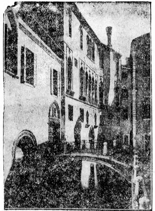
Velence nemzeti költőjének szülőháza.