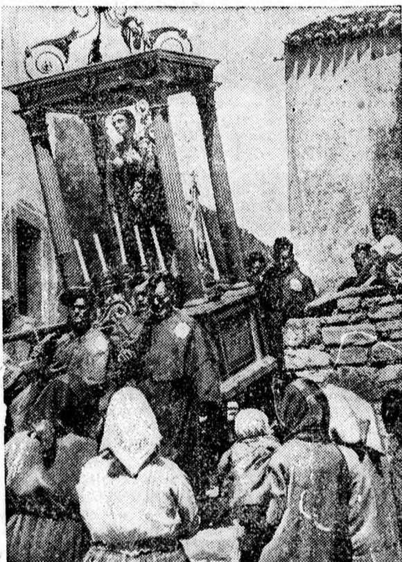
Festői körmenet Olaszországban.