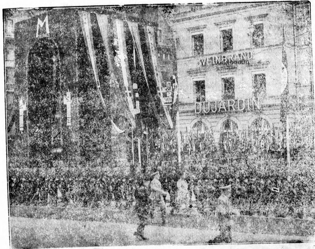
Mussolini és Hitler Münchenben állapnak az SS. alakulatok soriala előtt.

Üjjongó emberek százezrei lepték el München utcáit, amelyeken Hitler és Mussolini végighajtottak a pályaudvartól a Károly hercegi palotáig.