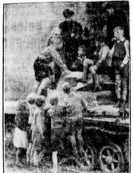
Az ifjuság — mindenütt kíváncsi.

A csehszlovák köztársaság első elnökének koporsóját szlovák táborszónok viszik ki vályukon a prágai várból, honnan Lanára szállították, ahol az ünnepies temetés végbement