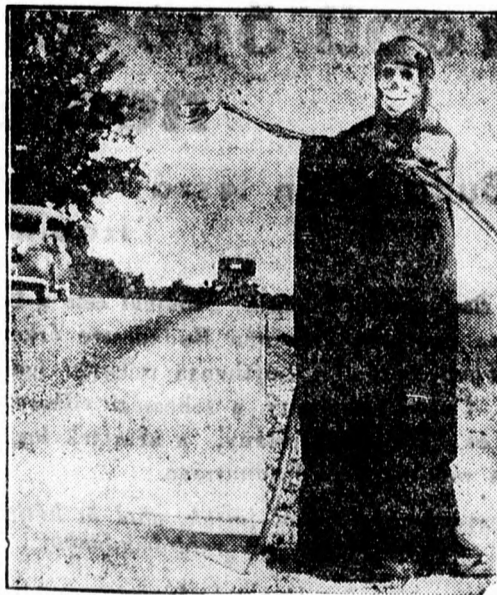
A halál figyelmeztet az országutakon...

Az északamerikai Arkansas államban az országutakon a képünkön látható halálfejes alakok figyelmeztetik a gépkocsi-vezetőket, hogy a sebes hajtás milyen veszedelmes. A halálfej koponyája éjszaka ki is van világítva s mióta ezt a figyelmeztető figurát alkalmazták, kevesebb baleset történt.