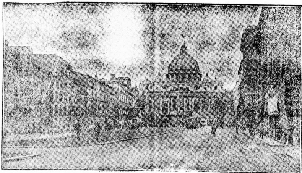
Restaurálták a „Bazilika Vaticanat“, Michel Angelo világhírű művét Rómában. Michel Angelo a legnagyobb olasz művész volt, az építész, szobrász, festő egyesült benne s a legnagyobb remekműveket alkotta. Igen vallásos volt, sokat jótékonykodott, s a Szent Péter templom csodálatosan szép kupolája építéséért — utolsó nagy műve volt ez, — semmit sem fogadott el

Sanghaiből jelentik: A japánok kedden hajnalban ismét megkezdték a szárazföldön, tengeren és levegőben egyaránt a kínai állások bombázását. Valószínű, hogy ez még csak előjátéka annak az általános támadásnak, melyre a japánok már hetek óta készülnek. A kínaiak elkésztett ellenállást fejtenek ki, sőt egyes pontokon már ellentámadásba is átmentek.