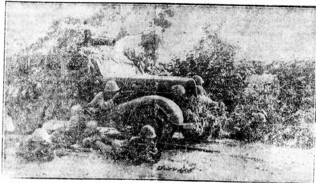
A Tientsin-Pukow közötti utszakasz Kinában, ahol véres harcok folytak. Képünk a harcokból való.

A légvédelmi próba alatt a főváros lakossága a legteljesebb figyelmet tanusította