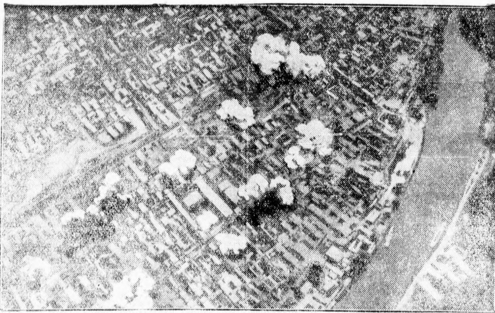
Japán bombavetők Csungcsau felett.

A „Journal des Débats“ is hasonló témát pendit meg és összefüggésbe hozza a tényt Herriot követelésével, hogy a szovjet fizesse vissza a franciáknak járó államadasságát. Ha Szovjet-Oroszországnak ujabban már annyi pénze van — mondja a lap, — hogy 3000 kommunista jelölt választási költségeit fedezheti, akkor kérdezzük meg az orosz kötvények francia tulajdonosait, a kisembereket, hogy miért nem kapnak kamatot? Ugy látszik, hogy a francia kormányzat eddig még nem gondolt erre az elsőrendű szükségességre. Tűrhetetlen az, hogy a kormányzat ezt a helyzetet egyszerűen csak tudomásul vegye.