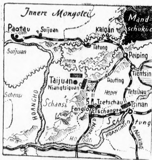
A japánok előrehaladása az északkeleti Honan tartományban.

Budapest I. 7.45 Torna. Utána: Gramofon. 8.20 Étrend. 11 Hírek. 11.20 és 11.45 Felolvasás. 12.10 Vízjelzőszolgálat. 13. Déli harangszó. 13.05 A rádió szalonzenekara. 14.30 Hanglemezek. 17.15 „Mese a természet”. 18. „Mit üzen a rádió?”. 18.30 Cigányzene. 19.20 „Egerben szüret után”. 20. „Magyar táncok a török időktől”. 20.45 Előadást. 21.50 Hangversenyzenekar. 22.45 Időjárásjelentés. 23.10 Jazz. 24. Cigányzene. 1.05 Hírek külföldi magyarok számára.