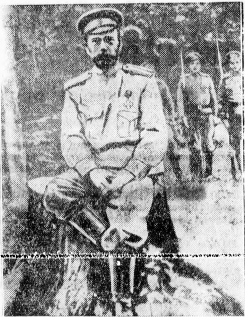
Miklós cár utolsó arcképe, kivégzése előtt.

Ez a terv azonban — mint ezt már mindenki tudja, — nem sikerült s a vörösök ki-