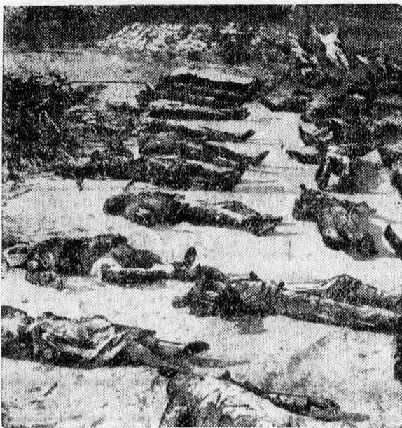
Az 1917 november 7-iki orosz forradalom kivégzett áldozatai.

A gépkocsin hamarosan elértek Gacsinba, majd Lugába, de a várt segédcsoportok nincse-