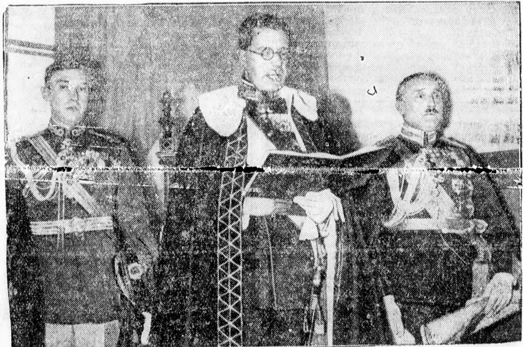
A svéd trónörökös, akit — mint megirtuk, — a cernauti egyetem disz doktorává avattak, felolvassa köszönő-beszédét az egyetemi ünnepegen.

Strajat megvásárolta a Venus. Clujról jelentik: A Victoria fiatal és nagytehetségű hátvédét, aki jelenleg Bucuresihben a testnevelési főiskolan tanul — megvásárolta a Venus. A Victoria 30 ezer lei készpénzt kap és egy bucaresti nemzetközi mérkőzés jóvedelmének hetvenöt százalékát. A Victoria valószínűleg a husvéti tornán játszik valamelyik külföldi csapat ellen. A Venus Strajat valószínűleg az utóbbi időben erősen formán alul játszó Abu helyett szerepelteti majd — de csak a jövő évben, miután a hátvéd már játszott a idén a Victoriában bajnokit.