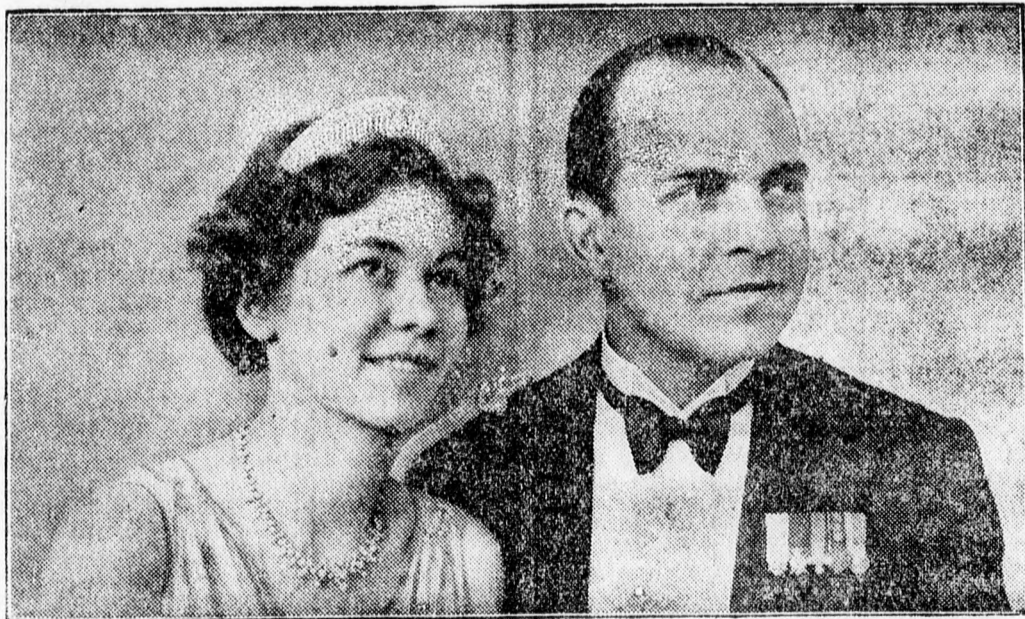
Pál görög trónörökös és felesége

A trónörökösén a jövőben az eddigi Friderika keresztnev helyett a Marguerita nevet fogja használni.