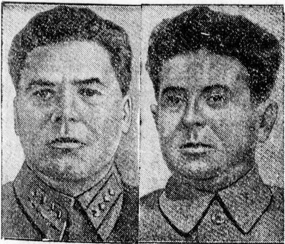
Stalin már Vorosilovtól is fél.

Mindent egybevetve megállapítható, hogy a város lakossága a legteljesebb mértékben eleget tett az előzetes felszólításnak s így fegyelmessége révén lehetővé tette, hogy a riadógyakorlatok a legkielégítőbb eredmény jegyében záruljanak.