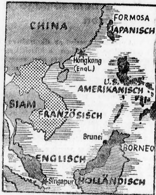
Hongkong megerősített kikötővárosát az angolok lázas tempóban fejlesztik és erősítik.

Tokióból jelentik: A kínai nagykövetség személyzete Japán elhagyására készült. A személyzet tagjai már útleveleik láttatkozását kérték.