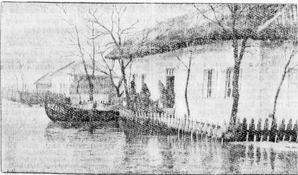
Víz alatt Vaikov.

műtét alkalmával nemcsak egy más tagból vett csontot, hanem a csontot környező szövetek egy részét is átültették és ezzel az eljárással a műtét tökéletesen sikerült. Ugyanakkor a világ minden nagyvárosainak klinikáján folynak az erre vonatkozó kísérletek. E klinikák vezetői bizonyára érdekes részleteredményekről számolnak be a kongresszuson.