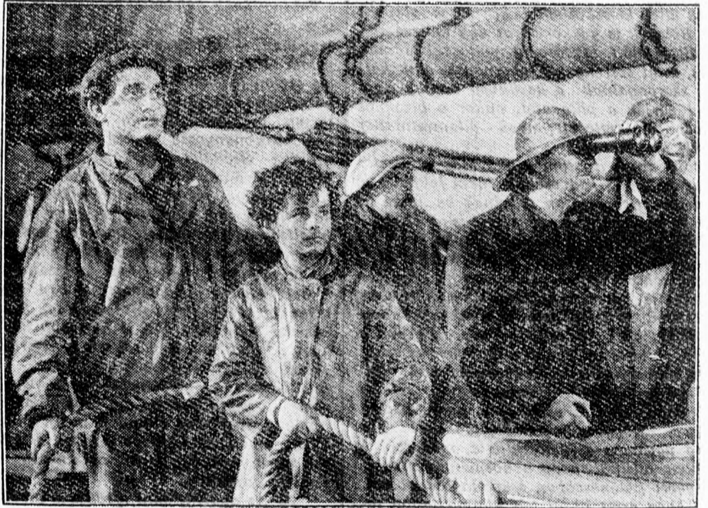
Film — nők nélkül.

Most érkezett Európába az az új amerikai film, amelyikben csak férfiszereplők vannak. A film egy halászdrama. A képen balról jobbra: Spencer Tracy, Freddy Bartholomeo és Lionel Barrymore (távesővel) láthatók.