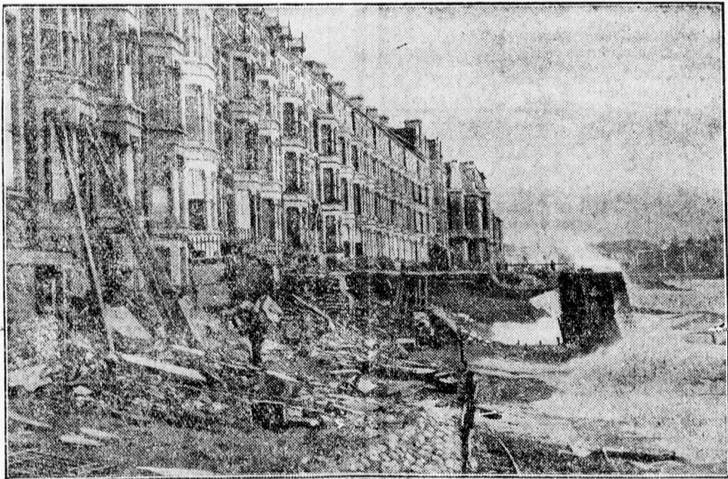
Aberystwyth angol város felett borzalmas erejű vihar vonult át. Különösen a parti házakat rongálta meg a vihar s egész balkonokat, háztetőket sodort el. Képünk a pusztulás helyén készült.

A Függetlenség azt az értesülést is közli, hogy politikai körök szerint Horthy kormányzó látogatásának Moscicki köztársasági elnök részéről történő visszaadására előreláthatólag már májusban sor kerül.