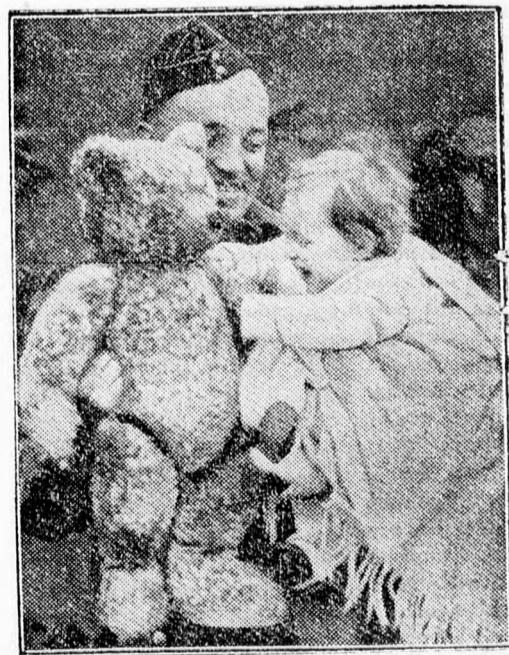
Indiából most térnek haza az angol katonák. Képünkön egy ilyen indiai szolgálatban volt katoná látható, kis gyermekével.