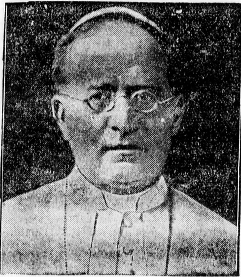
XI. Pius pápa

ritja és hivatásának céljait, terveit, — a jelen esetben Krisztus gondolatait és szándékait — megtestesíti és azok érvényesülését teljes odaadással dolgozik. Hivatás tehát a szó legnemesebb értelmében.