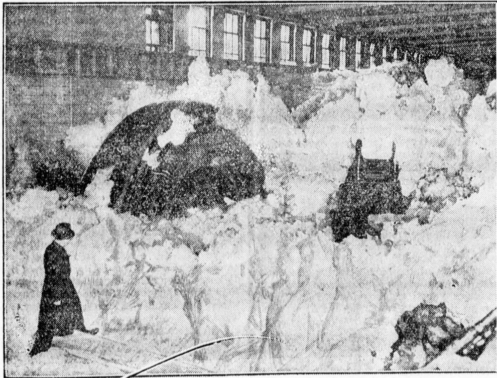
A Niagara vizesés befagyott jégtömege a Patkovizesés erőműveit is tönkretette. A víz behatolt a generátorhelyiségekbe s a jégtömeggel összetörődve, lehetetlenné tette az erőművek működését. Képünk az óriási jégtömeget mutatja.