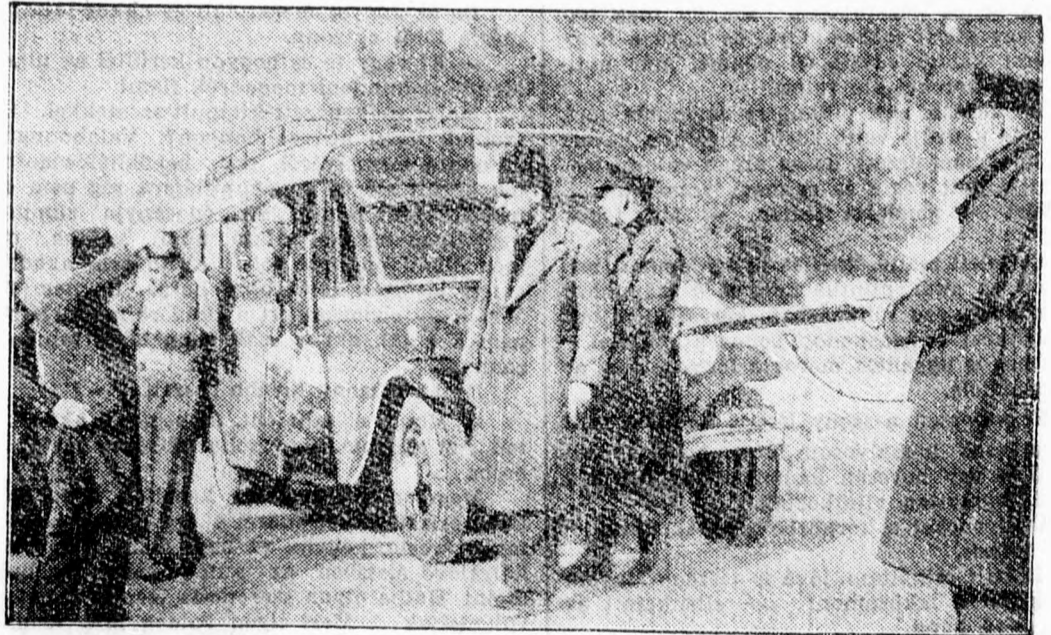
Palesztinában a közutakon közlekedő autóbuszok utasait megmotozza az angol katonaság, hogy meggyőződjék arról, nem rejtegetnek-e az utasok fegyvereket maguknál.

Mihalovics Zsigmond tb. kanonok, az Eucharisztikus Kongresszus és a Szent István év előmunkálatairól számolt be és ismertette, hogyan készülnek a világ legtávolabbi vidékein is Budapest felé, amely a kongresszus alatt egyetlen hatalmas világkatedrálissá válik. Huszár Károly volt miniszterelnök a katolikus vezető férfiak kötelességeiről beszélt, majd a hercegprímás zárószavai után véget ért a gyűlés.