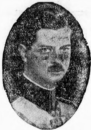
Őfelsége II. Károly király

53. szakasz. A törvényhozási tagok nem le-