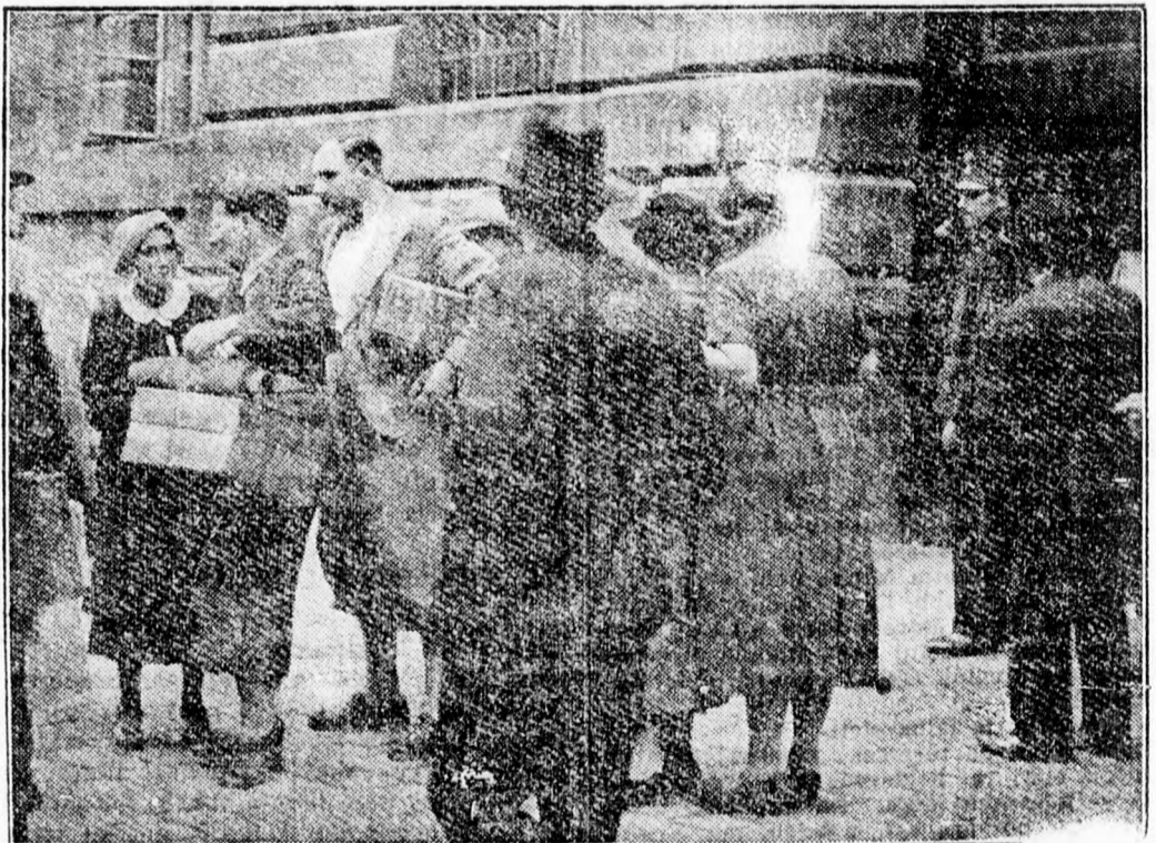
Mint ismeretes, a berchtesgadener megegyezés alapján a politikai foglyok amnesztiát kaptak Ausztriában. Képünk a bécsi államfogház előtt készült azokról, akik most elhagyhatták a börtönt. A fogház kapuja előtt a kegyelemben részesültek hozzátartozói várakoznak

Rengeteg munkával jótették az évszázadok romlásait. Leonardo „Utolsó vacsorája” tehát megmenekült, emberi számítás szerint hosszú időre, a sorscsapások elől.