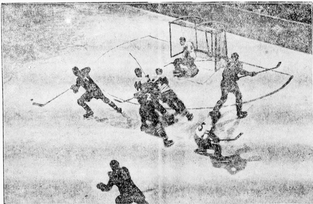
A prágai jégkori versenyeken Németország csapata a magyarországi csapattal mérkőzött és 1:0 eredménnyel győzött a magyar csapat felett. Képünk a döntő küzdelemtől készült.